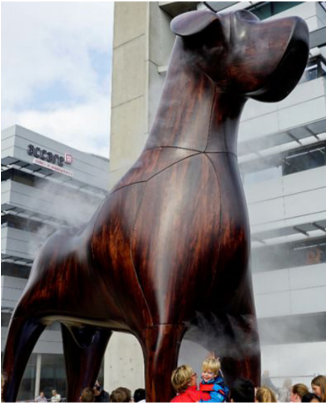
Figuur 3 Mannes, beeld Serafijn en NIO; links: bij oplevering in 2018, rechts: na herstel in 2021