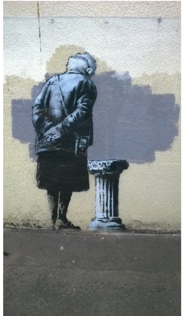
Figuur 7 Art Buff, Banksy, Folkestone

Naar Nederlands recht zou in de Banksy-casus moeten worden beoordeeld of de muurschildering een 'bestanddeel' is van de muur van het gebouw. Wigman komt in zijn beschouwing, 23 via een toepassing van art. 5:3 jo. art. 3:4 BW, tot de conclusie dat dit inderdaad het geval is en dat de eigenaar van het gebouw naar Nederlands recht ook eigenaar van de muurschildering is geworden. Hoewel een 'mural' niet op grond van de 'verkeersopvatting' (art. 3:4 lid 1 BW) deel zal uitmaken van het gebouw, kan de schildering immers vermoedelijk niet 'zonder beschadiging van betekenis' worden afgescheiden van de muur, zodat aan het criterium van art. 3:4 lid 2 BW zal