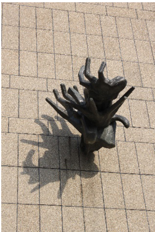
Figuur 4 Handen, Willem Reijers, Cygnus Gymnasium Amsterdam

De weduwe van kunstenaar Reijers dwong tot aan de Hoge Raad, op grond van een uitleg van de overeenkomst, plaatsing van het beeld Handen (figuur 4) op de oorspronkelijk beoogde locatie af. 8 De rechtbank had nog overwogen dat plaatsing van het werk op een andere dan de beoogde plaats geen wanprestatie opleverde. Het hof ging daar niet in mee en legde de tussen Reijers en Patrimonium gesloten overeenkomst aldus uit dat deze de opdrachtgever verplichtte het beeld uitsluitend aan te brengen op de gevel van de 1e Lagere Technische School in Amsterdam, de plaats waar het beeld (ondanks het ontbreken van een uitdrukkelijk beding) voor bestemd en (specifiek) ontworpen was en de plaats waarop de overleden kunstenaar het zich had voorgesteld. De Hoge Raad sanctioneerde de uitspraak van het hof.